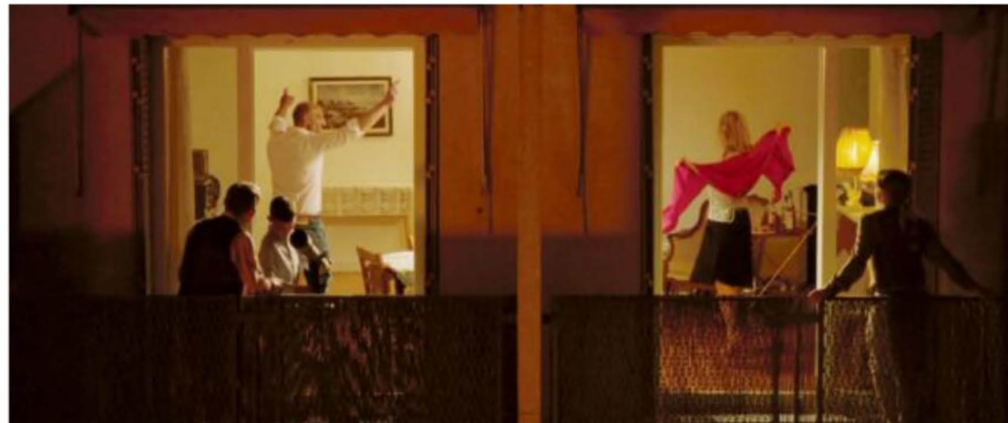
Un balcon à Limoges.